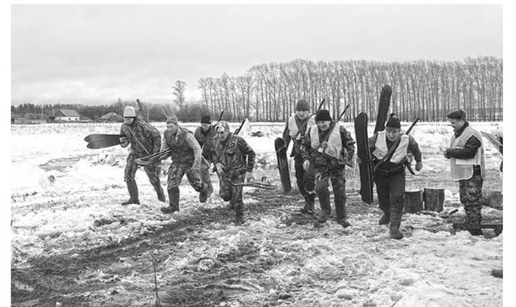
Стартуют команды «Медведи» (Оханск) и «Охотники на привале» (Острожка)

зкое бревно. Здесь хоть и трудно, но надо держаться. Нельзя падать, поскольку уметь, да и прыгивать с бревна нужно уметь. За ошибки судьи наказывают строго, начисляя штрафные баллы. В завершение дистанции еще один огневой – стрельба по летящим с большой скоростью в воздухе «тарелочкам». Стреляют по очереди. Вот и все. Финиш! Судьи засекают время по завершающему дистанцию участнику.