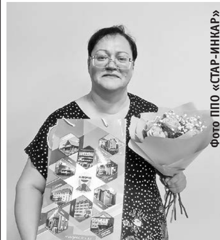
Фото ППО «СТАР-ИНКАР»

В канун 75-летия Пермского крайсовпрофа в группе «Профсоюзный курьер» в социальной сети «ВКонтакте» был объявлен онлайн-тест «Знатоки от профсоюзов», посвященный истории профсоюзов Прикамья.