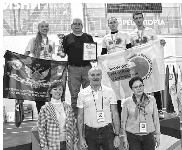
Победители спартакиады, повторившие прошлогодний успех