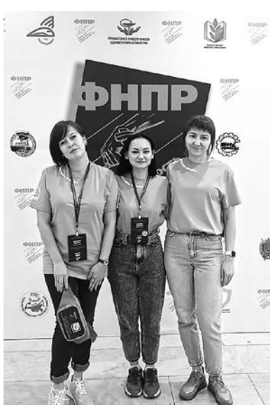
Наши делегаты на форуме