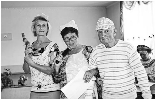
Дефиле летних панамок. Команда «Газовичок»

Действительно, с каждой игрой все ярче видна именно командная работа. Активность, целеустремленность, уверенность выходят на новый уровень и становятся общим делом. Команды быстро выдают правильные ответы об учреждении Дня России и дне рождения Пермского края, точно знают, сколько колхозов и совхозов было на территории Оханского района в 80-е годы прошлого века. Практически все указы-