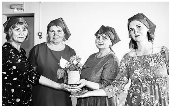
На позитиве! Команда «Девчата»

Но праздник – праздником, а впереди целое лето. У детей – каникулы, у взрослых – отпуск. Поездки, путешествия,