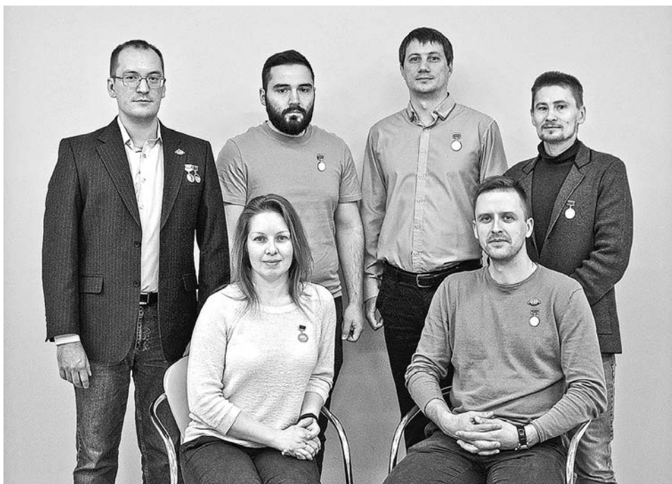
Молодые сотрудники ПНИТИ, лауреаты Всероссийских конкурсов «Лучший инженер года»

Мы активно участвуем в процессе оздоровления сотрудников института и всесторонне поддерживаем здоровый образ жизни. Для работников и их детей предусмотрена компенсация оздоровительного отдыха. Предприятие оказывает сотрудникам материальную помощь