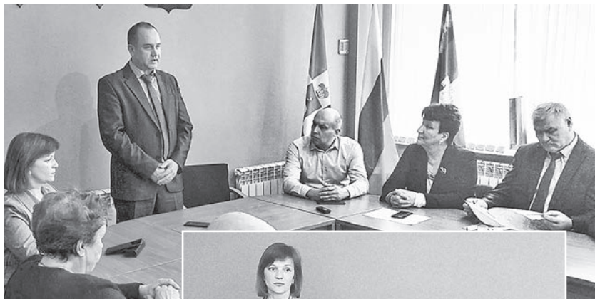
Встреча с главой округа

– Мы, со своей стороны, поддерживаем инициативы координационного