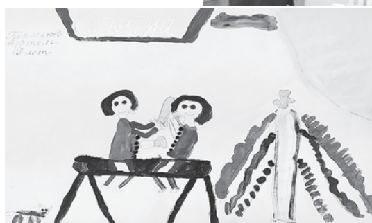
Сабантуй. Рисунок Артема Пермякова, 9 лет