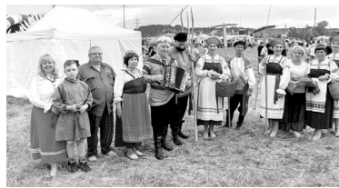
Коми-пермяки из Юсьвы и Соликамска подружились

и этнических общностей. Пермский край и СГО, в частности, в этом отношении являются уникальными территориями. Здесь проживают несколько десятков народностей, проводятся национальные культурно-массовые мероприятия, в том числе и в рамках проекта «59 фестивалей 59 региона».