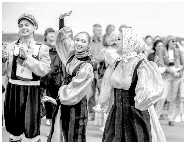
Массовка на причале. Актеры – студенты ПГИК

Больше информации в социальных сетях: https://vk.com/clubletodachakachka , https://vk.com/ukccis