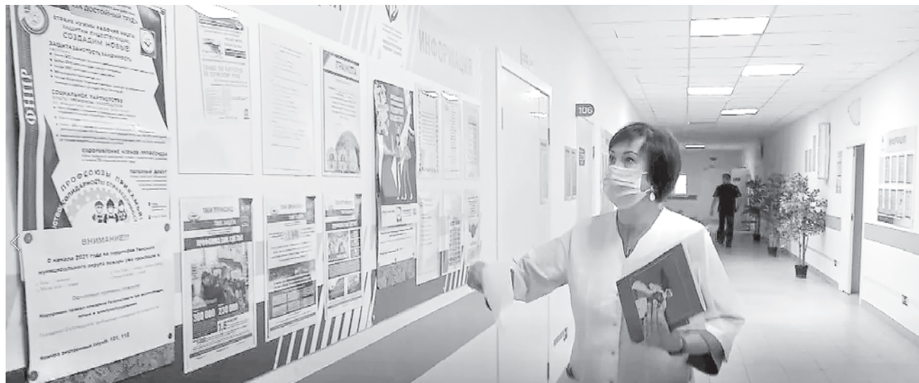
На профсоюзном стенде всегда актуальная информация

прочем, послепандемная жизнь в Уинской ЦРБ постепенно возвращается в свое русло. На привычную активную волну настраивается и профсоюз. 12 мая провели первый большой праздник – День медицинской сестры. Сейчас идет подготовка к Дню медицинского работника. Планируется торжественное вручение грамот, подарков, члены профсоюза впервые получат дисконтные карты. А еще будет долгожданный вечер в кафе, где встретится весь коллектив, ведь в прошлом году медработникам было не до праздника.