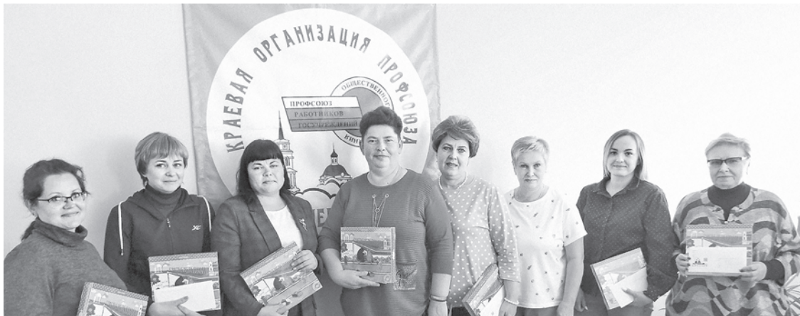
Председатели первичек психоневрологических интернатов Прикамья, коллективы которых вчера отметили свой профессиональный праздник