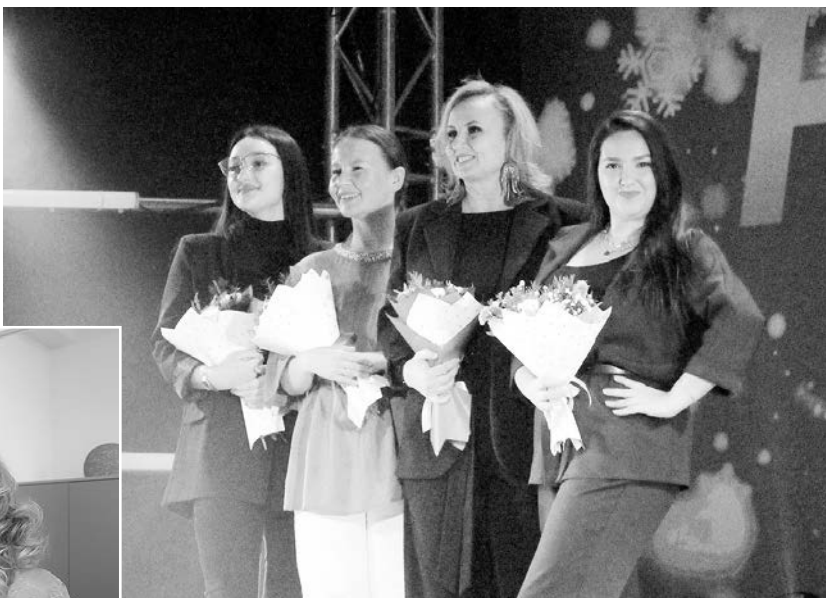
На сцене — наставники заводских артистов

и зрителей от 12-го цеха в зале было немало — с цветами и подарками. Они не дожидались вердикта жюри, а сразу поднимались на