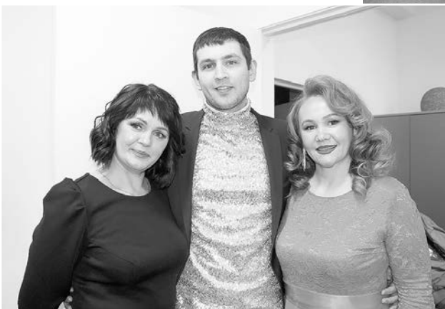
Участники из цеха № 12 АО «ОДК-ПМ»

Цех № 12 АО «ОДК-Пермские моторы», например, был представлен в финале сразу тремя номерами — сольным пением и художественным словом. А потому