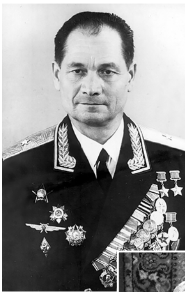
Брат – дважды Герой Советского Союза Григорий Сивков

изрешеченных пулями и снарядами вагонов. Казалось, они просвечивают насквозь и вот-вот развалятся.