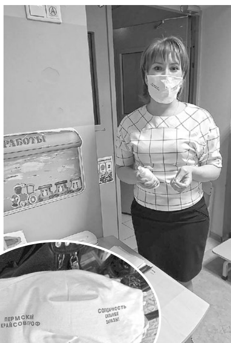
Маски у воспитателей детского сада «Эврика»

Большая часть масок роздана вместе с тиражом «Профсоюзного курьера» наиболее крупным первичкам – подписчикам газеты в краевом центре, а также первичной профорганизации МУП «Пермгорэлектротранс», совету молодых педагогов Пермской краевой организации профсоюза работников народного образования и науки РФ. Пусть масок не так много, как хотелось бы, но это сегодня реально нужные защитные вещи.