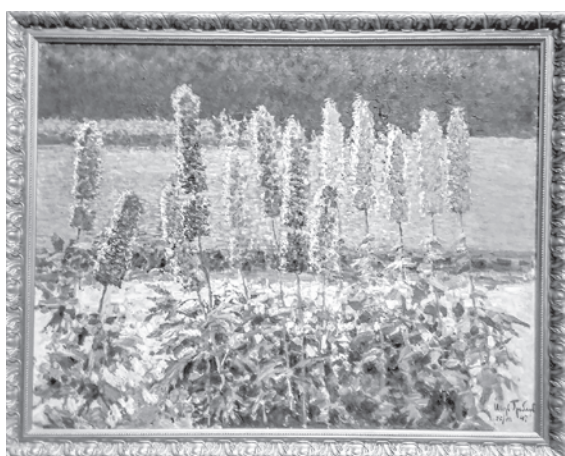
Игорь Грабарь. В саду. Грядка дельфиниумов. Курский музей – копия

В ПЕРМСКОЙ ХУДОЖЕСТВЕННОЙ ГАЛЕРЕЕ РАБОТАЕТ ВЫСТАВКА «СОКРОВИЩА МУЗЕЕВ РОССИИ»