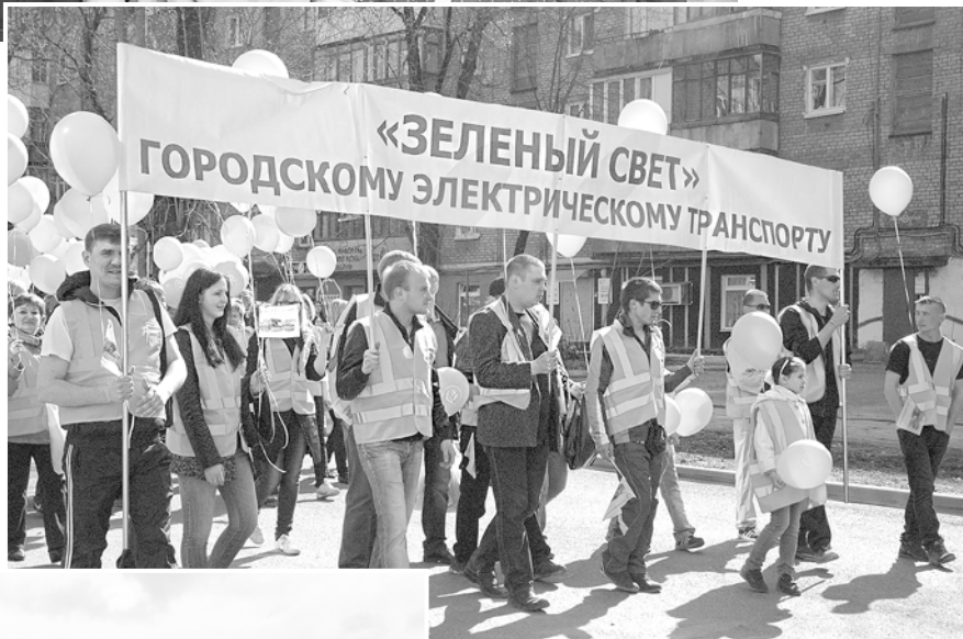
Акция «Нет – росту цен на топливо!» (2008 г.)