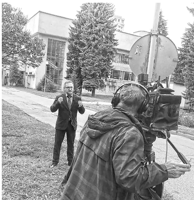
Вторую неделю подряд ФНПР попадает в топ-новостей всех федеральных СМИ

Департамент общественных связей аппарата ФНПР