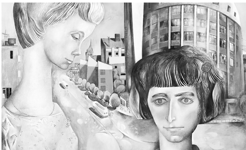
Брусиловский М. Ш. Картина. Таня и Света

Миша Шавевич Брусиловский (1931–2016) – живописец, монументалист, график, запрещенный художник эпохи советского андеграунда, снискавший мировое признание. Творчество Брусиловского – это огромная энергия