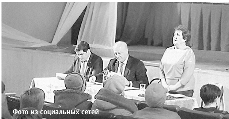
Фото из социальных сетей