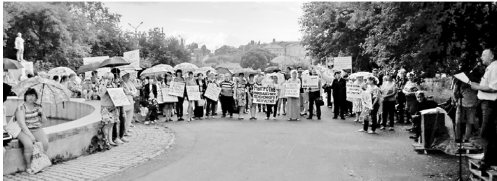
Митинг протеста против повышения пенсионного возраста в Лысьве 10 июля 2018 года

Радикально изменились функции и методы работы Пермского обкома ГМПР. Сегодня основной задачей всех профсоюзных органов является изменение в массовом сознании работников представления о профсоюзе, поскольку профсоюз не может и не должен быть распределителем материальных и нематериальных благ. Профсоюз должен и может защищать интересы работников всеми