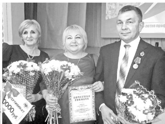
Награды – заслуженные

тором СКРУ-3. Не изменил ли он своего отношения к профсоюзу?