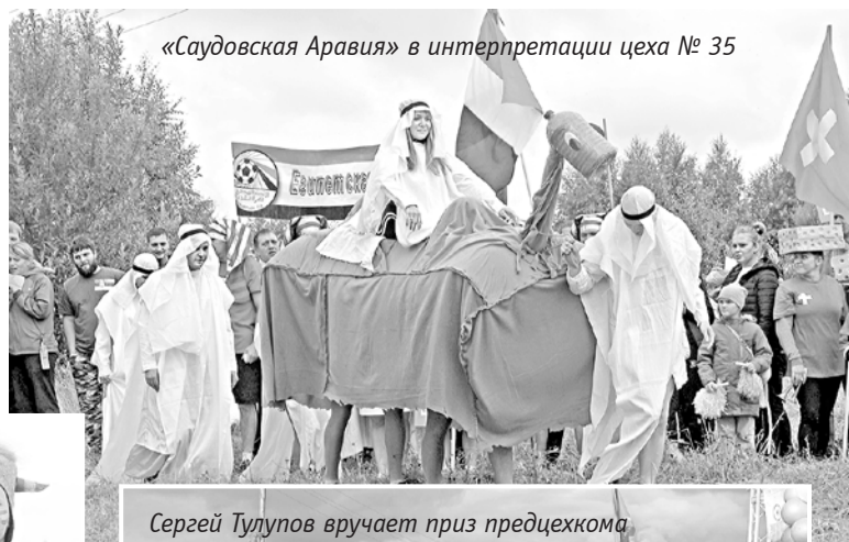
«Саудовская Аравия» в интерпретации цеха № 35

Его совместно проводят администрация предприятий и первичная профсоюзная организация «Пермские моторы». Фестиваль устоявшийся, а тему каждый раз придумывают новую. В этом году, конечно же, главной темой был футбол, а мероприятие получило название фестиваль болельщиков. На один день термисты и сварщики, сборщики и испытатели превратились в болельщиков команд – участниц чемпионата мира по футболу. Избранной