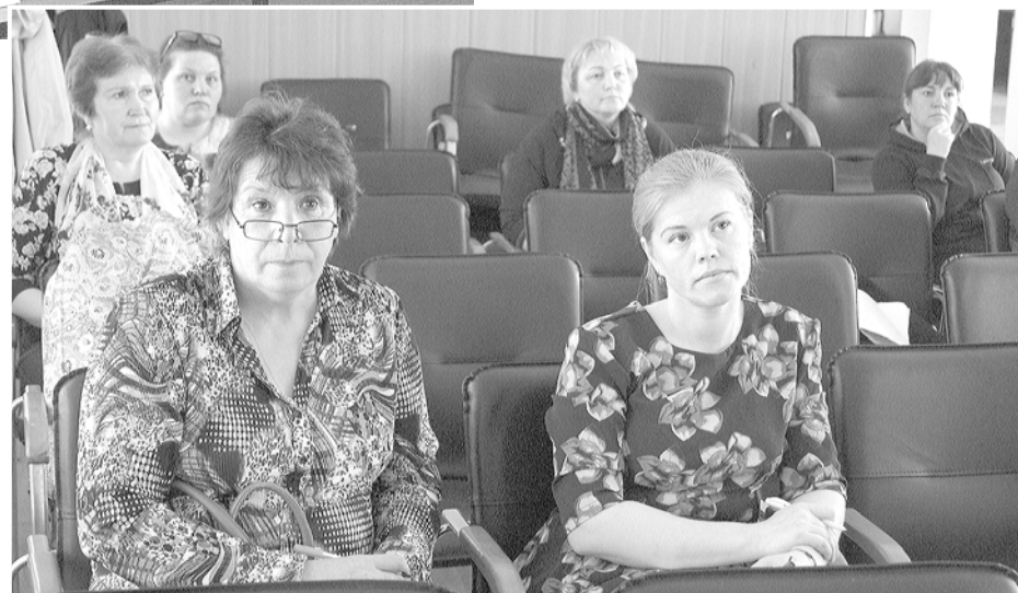
Профактивисты с интересом слушали главу Юсьвы