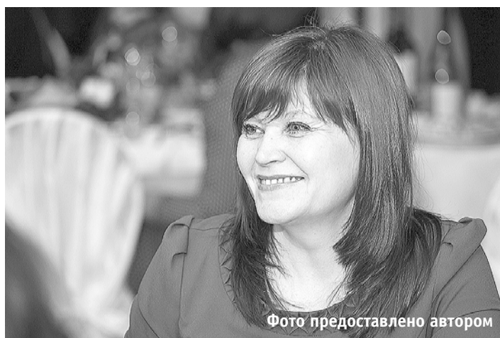
Фото предоставлено автором