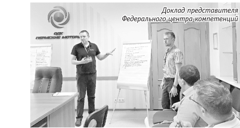
Доклад представителя Федерального центра компетенций

По результатам экспресс-аудита был сформирован перечень положительных практик АО «ОДК-ПМ», таких, как визуальное управление процессом сборки с помощью маркерных досок, использование в работе матриц компетенций, высокий уровень чистоты территорий и рабочих зон, развитую систему защиты от ошибок и пр. Сформированы предложения по совершенствованию производственных направлений: повышение уровня механизации выполнения