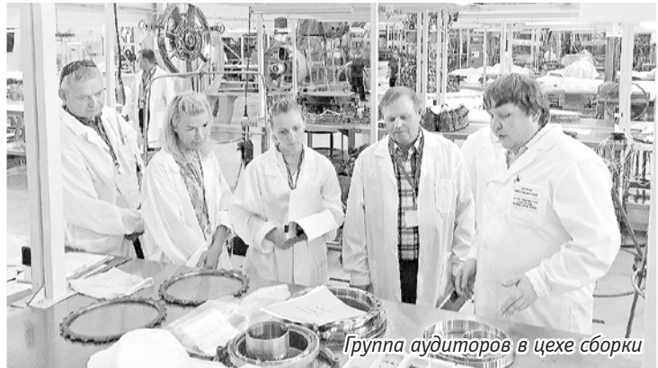
Группа аудиторов в цехе сборки