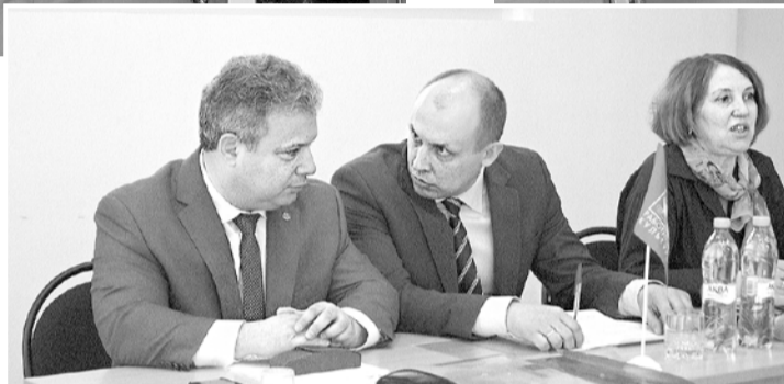
Социальные партнеры: за одним столом

выделения дополнительных средств муниципалитетам, несоблюдение законодательства в части индексации оплаты труда, игнорирование вопроса установления базовых ставок и должностных окладов для работников бюджетной сферы и т. д.