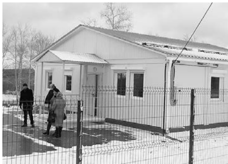
Фельдшерско-акушерские пункты открыты в четырех поселениях района

Самая актуальная на сегодняшний день тема для кизеловцев — ситуация в медицинском обслуживании.