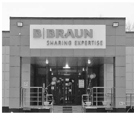
Новый центр гемодиализа

Хорошими новостями встречает Новый год березниковская медицина. И дело здесь не только в обещанной краевым министерством здравоохранения существенной прибавке к жалованью работников, но и в том уровне медицинских услуг, которые стали оказывать во втором по величине городе Пермского края.