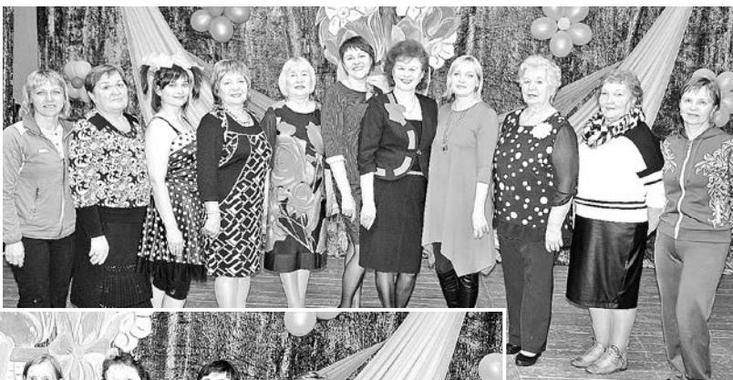
Учителя Дубровской средней школы

Дубровские работники культуры, в совершенстве владеющие искусством творить и удивлять, вновь устроили для односельчан праздник – давно полюбившийся