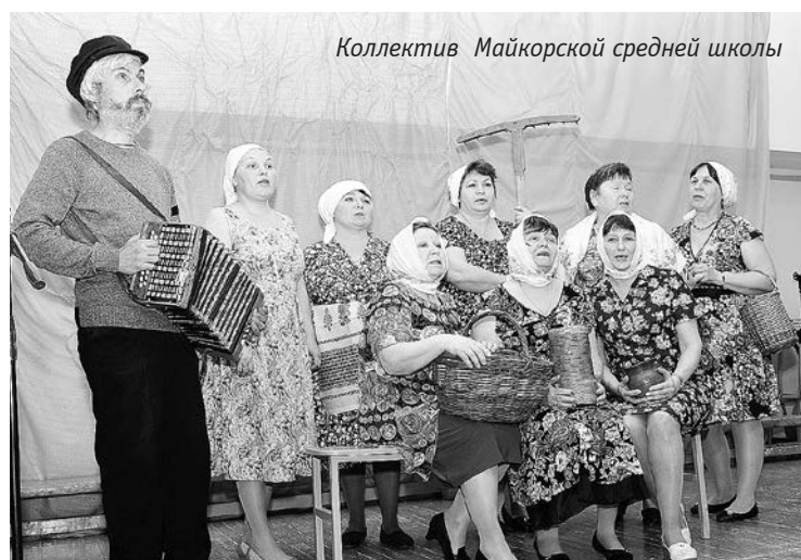
Коллектив Майкорской средней школы