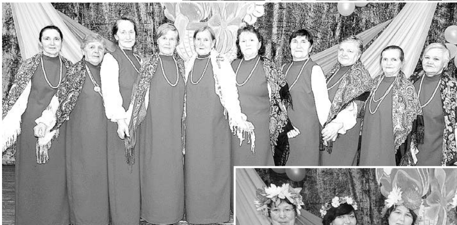
Артисты из ООО «Дуброво-Агро»