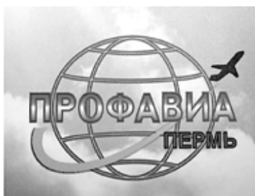
Так выглядит новая эмблема территориального совета Роспрофавиа

Территориальный совет был создан в 2000 году членами первичных профсоюзных организаций предприятий авиационной направленности города Перми. На 1 января 2016 года эти профорганизации объединяли более 10 тысяч работающих членов профсоюза, а также 7,5 тысячи неработающих пенсионеров. Кроме того, в состав Пермского совета Роспрофавиа входит более 1100 учащихся авиационного техникума. Это будущее профсоюза. А потому в отчетном докладе и в разговорах в кулуарах было отмечено, что необходимо вырабатывать новые формы работы для более активного привлечения в профсоюз именно учащейся молодежи.