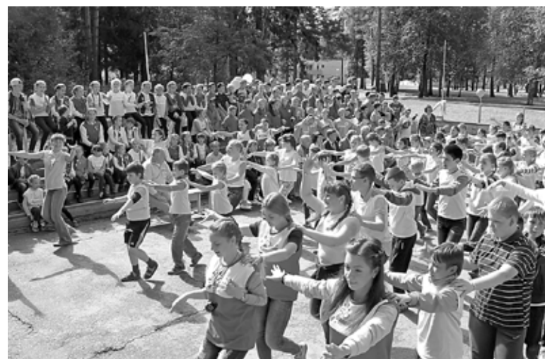
В лагере всегда можно найти новых друзей

Хотелось бы, чтобы наших детей в лагерях не только кормили, но и духовно развивали. Чтобы они учились помогать друг другу, меньше смотрели на недостатки других, а исправляли свои. Это можно сделать только в коллективе, так как в семье дети, как правило, покладистые.